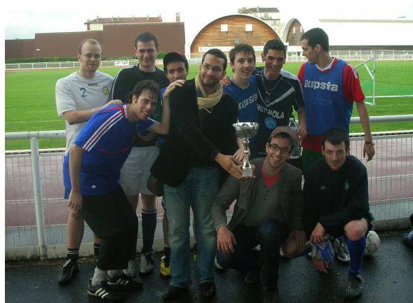
L'équipe d'ENSAI Babel passe entre les gouttes pour décrocher son 1 er titre